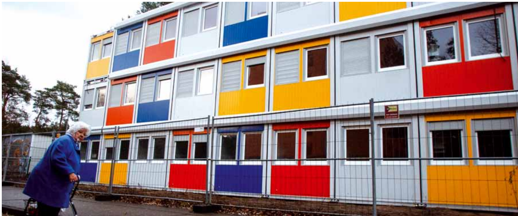
Farbe kann nicht darüber hinwegtäuschen: Auch im „Containerdorf“ im Allende Viertel leben die Menschen meist isoliert.

Geflüchtete müssen dicht an dicht unter unwürdigen Bedingungen leben. Der Berliner Senat hat diesen Notstand bewusst provoziert.