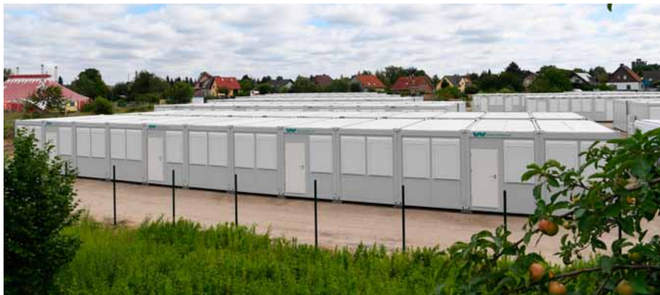
Seit kurzem eröffnet: Das Tempohome in Altglienicke.

Es gibt aber noch mehr an dieser Unterbringungspolitik zu kritisieren, die sich am bestehenden Lagersystem orientiert. Die Menschen werden durch das Leben in Lagern von der Gesellschaft isoliert und stigmatisiert. Sie werden erst recht zu „Fremden“ gemacht, die nicht wie „wir“ in Wohnungen leben dürfen. Ein Austausch mit den neuen Nachbar*innen wird so erschwert. Sie werden dadurch leichter zur Zielscheibe des Hasses von Rassist*innen und gewalttätigen Rechten. Die über 1.000 Angriffe auf Unterkünfte (davon mindestens 126 Brandanschläge) im letzten Jahr machen das deutlich.