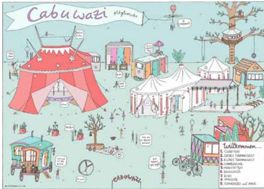
Im Zirkus Cabuwazi gibt es einiges zu entdecken – für Groß und Klein aus aller Welt.

D: Es ist wichtig, dass wir sensibel für verschiedene Bedürfnisse sind und dass spezielle Angebote gebraucht werden. Man kann nicht einfach alle Kin-